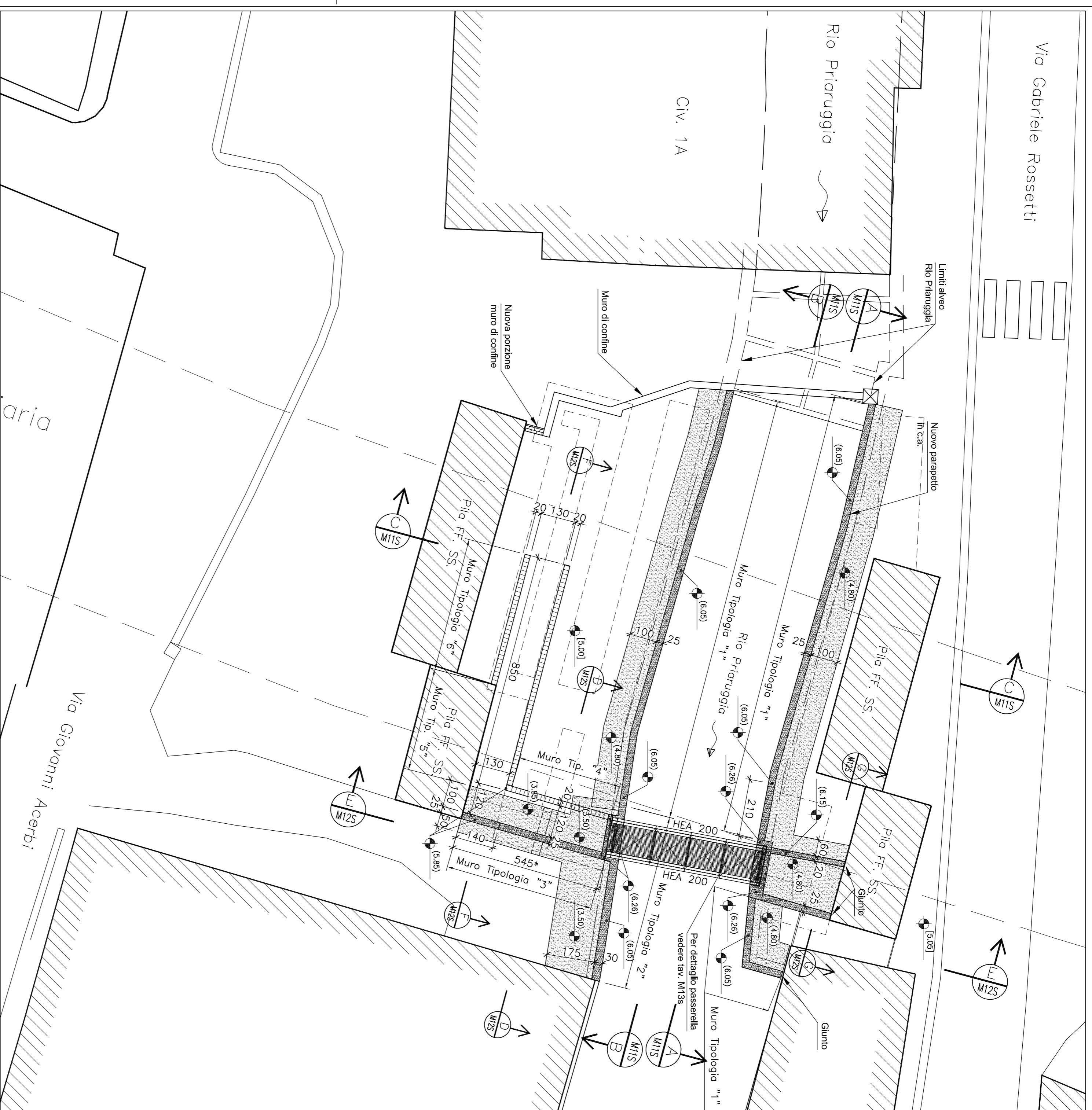
Pianta muretti rampa sponda destra