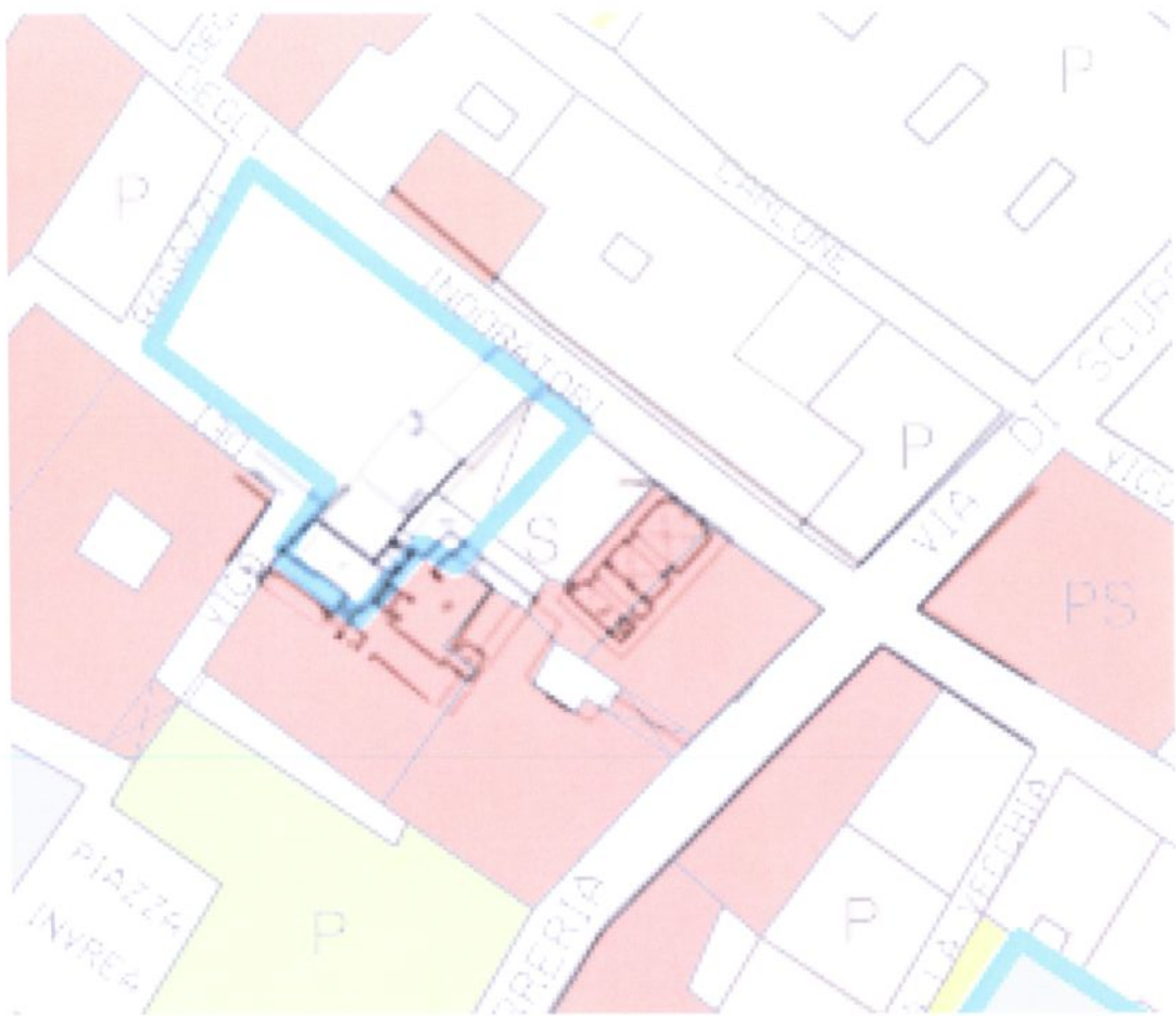
Sovrapposizione Tavola centro storico PUC in salvaguardia e planimetria Vico Ragazzi 14R