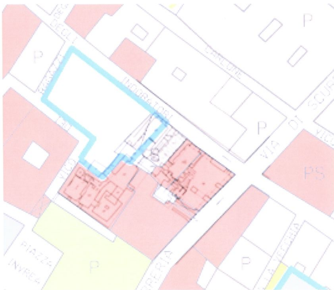
Sovrapposizione Tavola centro storico PUC in salvaguardia e planimetria Vico Indoratori 29R