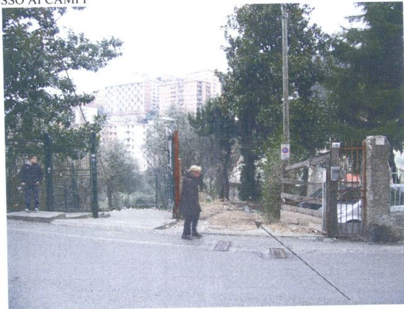
VISTA DELL'ACCESSO DA VIA TANINI 11