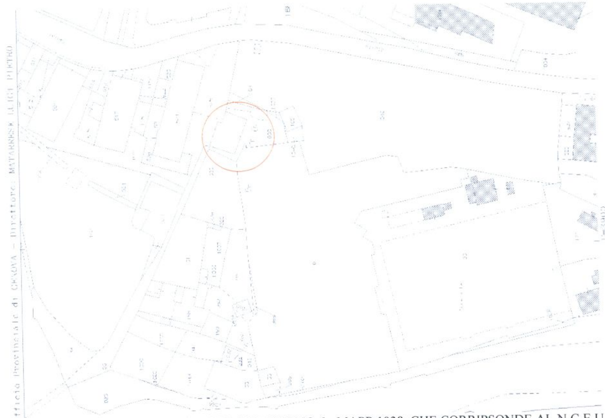
ESTRATTO MAPPA CATASTALE -SEZ APP FOGLIO 6 MAPP 1038, CHE CORRISPONDE AL N.C.E.U SEZ. APP FOGLIO 47 MAPP.163 SUB 1