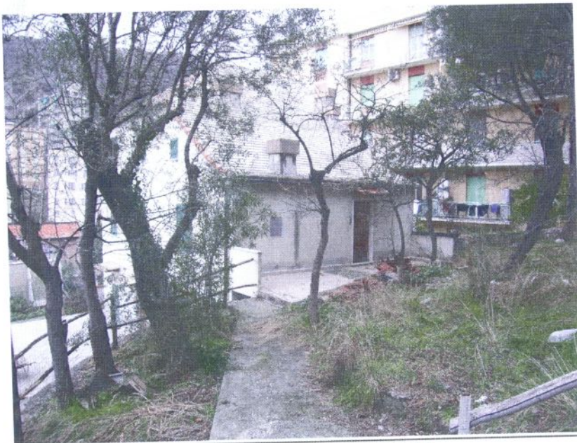
VISTA DELL'IMMOBILE VIA TANINI 11