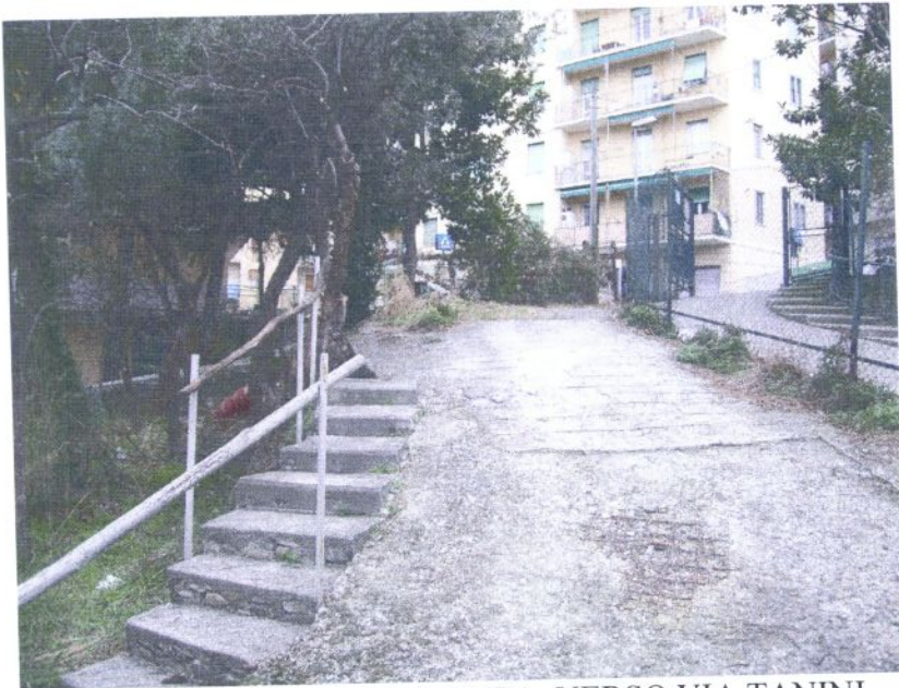
VISTA DELLA DOPPIA RAMPA VERSO VIA TANINI