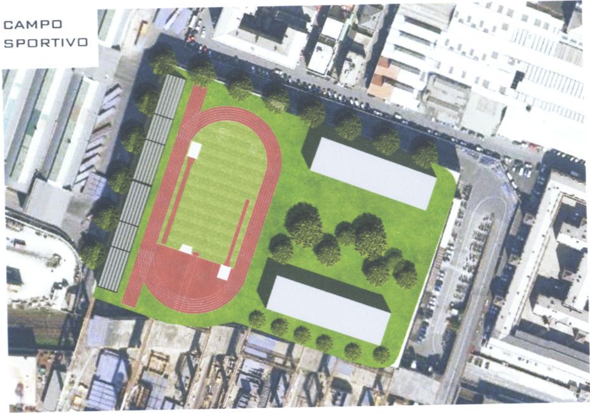
FIG. 3 Esempio di impianto di atletica leggera in area interessata da ribaltamento a mare di Fincantieri