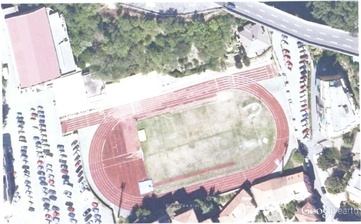
Fig.1 Impianto sportivo Marco Pala di Cogoleto Genova

Questo impianto e' costituito da una pista ad anello di 250 mt a sei corsie , da un rettilineo per la velocita' 100 mt e da una zona centrale in erba per le altre discipline base dell'atletica, oltre ad una gradinata per il pubblico, palestra e spogliatoi.