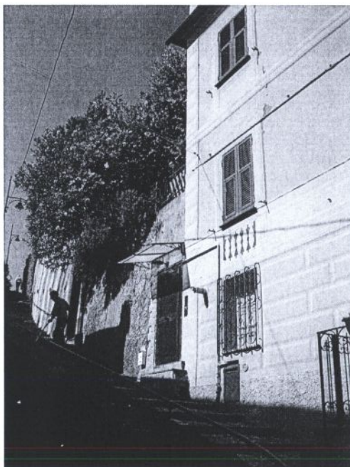
Ripresa fotografica da Via Urania