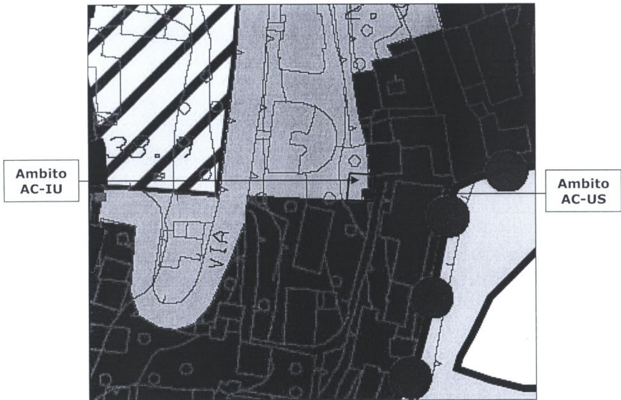
Stralcio della Tavola 3.9 - Progetto Preliminare di P.U.C. adottato con D.C.C. n. 92 del 07/12/2011