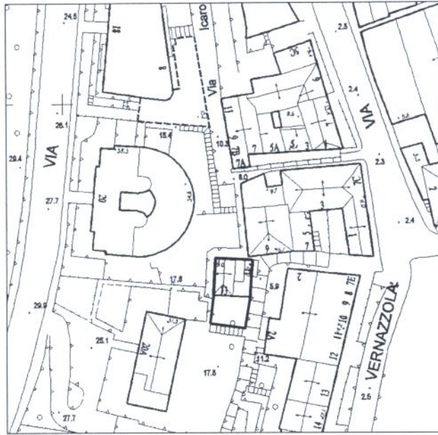
Stralcio della Tavola di Rilievo Comunale