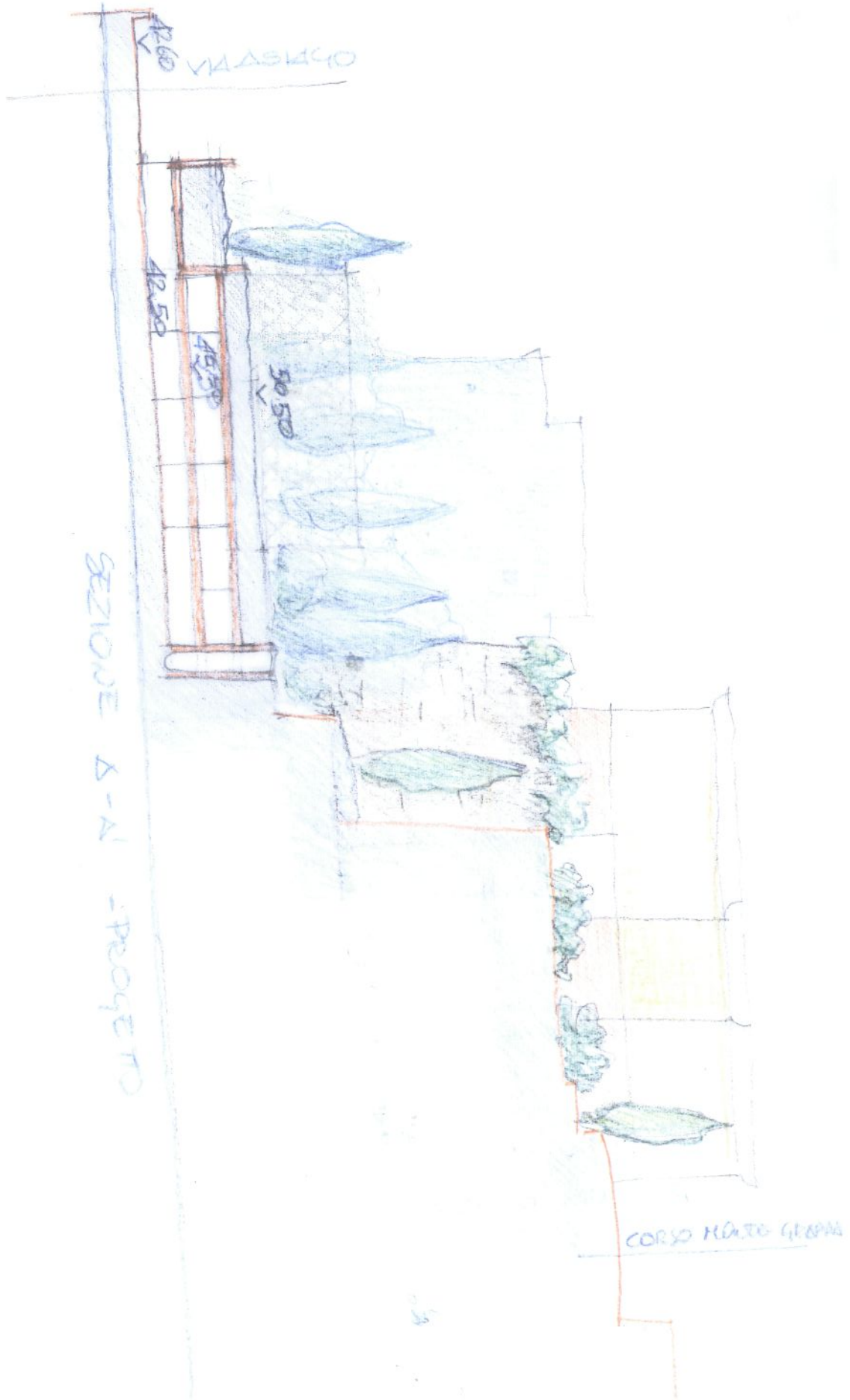
Tavola n. 4